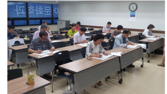
동양학과와 민간자격증 시험이 실시되고 있습니다.