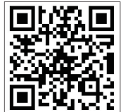
다음카페 동양학과 학생회 QR코드