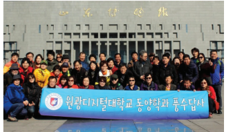
국제적 감각을 키우기 위한 해외풍수 답사를 실시 합니다.