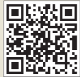
동양학과 소개 동영상 갤러리 QR코드

동양학과 학생회 카페 주소 : http://cafe.daum.net/wddy