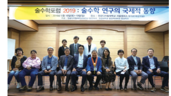
동양학과 주최로 저명학자·술수 전문가를 모시고 술수학 포럼을 개최하고 있습니다.