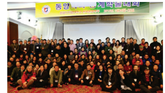
탄탄한 조직력을 자랑하는 동양학과 학생회주관으로 학술대회와 엠터를 통하여 우리는 하나가 됩니다.